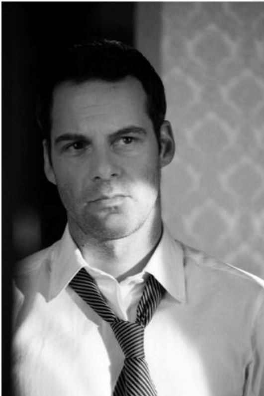
© Alexander Wolf, Fotograf: Sven Hagolani, Stand: 02/09