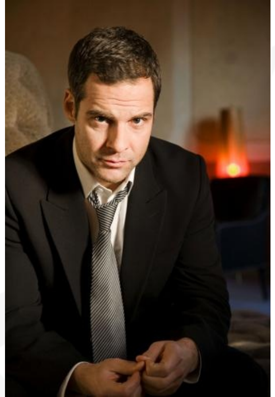
Stand: 02/09