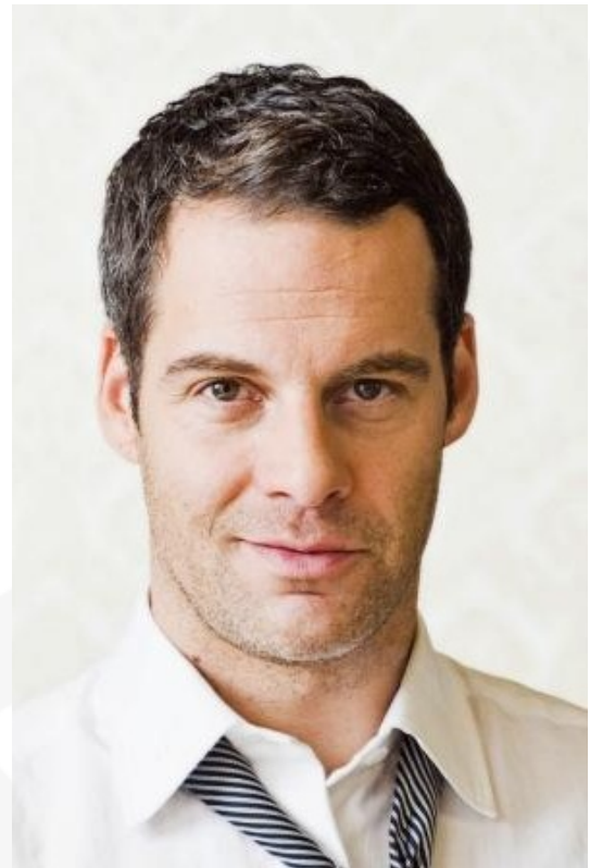
Stand: 11/2008

Sprachen Deutsch Muttersprachen, Amerikanisch sehr gut, Spanisch fließend Dialekte Bayerisch, Berlinerisch, Hessisch, Kölsch, Sächsisch, Türkisch Gesang Pop / Rock (geübt), Stimmlage: Tenor Sport Tennis (Profi), Basketball (sehr gut), Fußball (sehr gut), Handball (sehr gut), Volleyball (sehr gut), Fitness (sehr gut), Tischtennis(sehr gut), Snowboard (sehr gut), Badminton (sehr gut), Boxen (geübt), Yoga (geübt) Tauchen (mit Schein, open water diver) Führerschein Klasse 3 Sonstiges Pan-europäischer Typ, kann von Däne bis Spanier alles sein. Sehr Dialekt-begabt. Geboren in Oakland, Kalifornien, USA. Aufgewachsen 7 Jahre in San Francisco, USA. Sprecher-Erfahrung